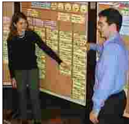
Projektarbeit in der Praxis

Mit meinen breit gefächerten und in zahlreichen Projekten vertieften Kenntnissen über die unterschiedlichsten Arbeitsprozesse hoffe ich mich qualitativ von den Wettbewerbern abheben zu können. Zudem erleichtern diese Kenntnisse und Erfahrungen die Kommunikation mit den Mitarbeitern in den Unternehmen.